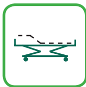
JALKAOSAN NOSTOKULMA 0 - 30°