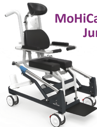
MoHiCan II Junior