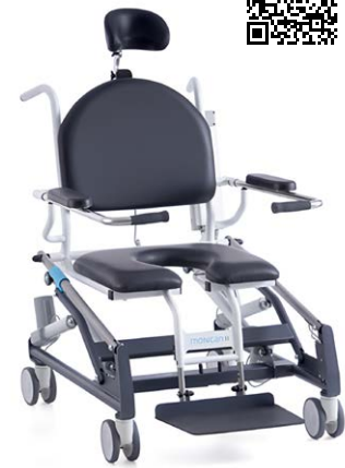
MoHiCan II Plus